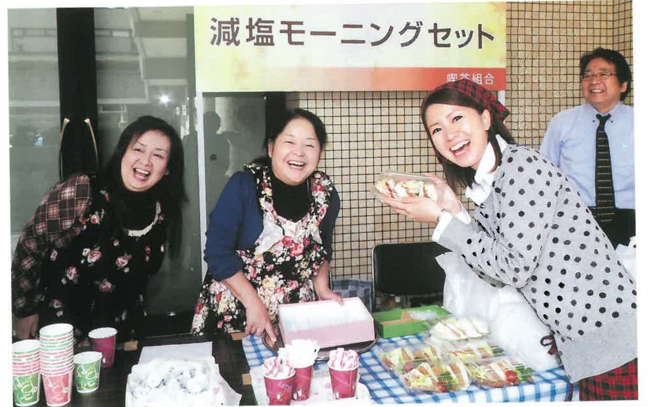
笑顔・健康・幸せ 朝一番!喫茶店のヘルシーモーニングで楽しい一日のスタートを=喫茶組合