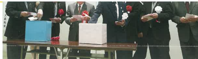
の各理事長による