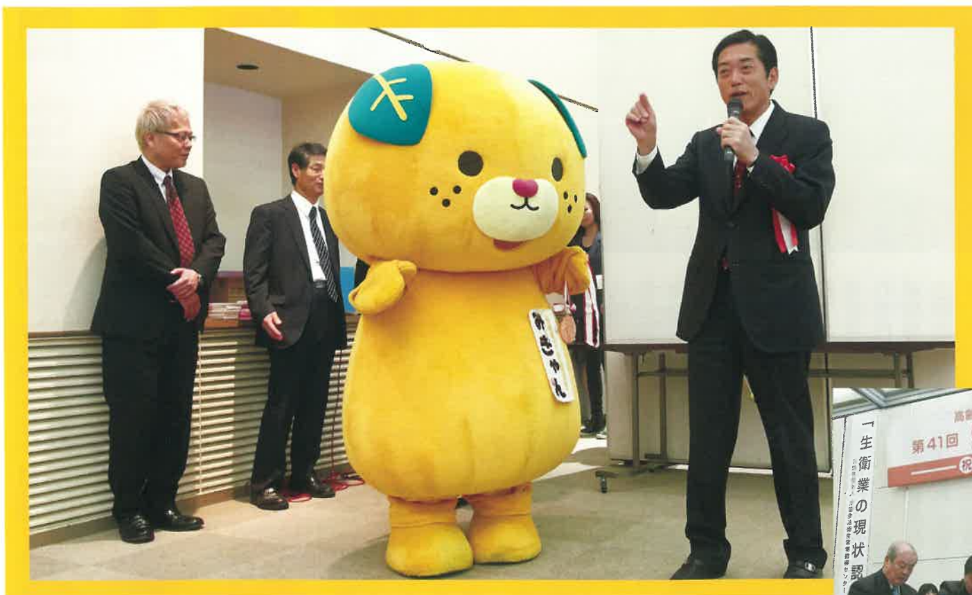
▲2017年の国体開催までには、みきちゃんのグランプリ獲得を!と応援メッセージをおくる中村知事。