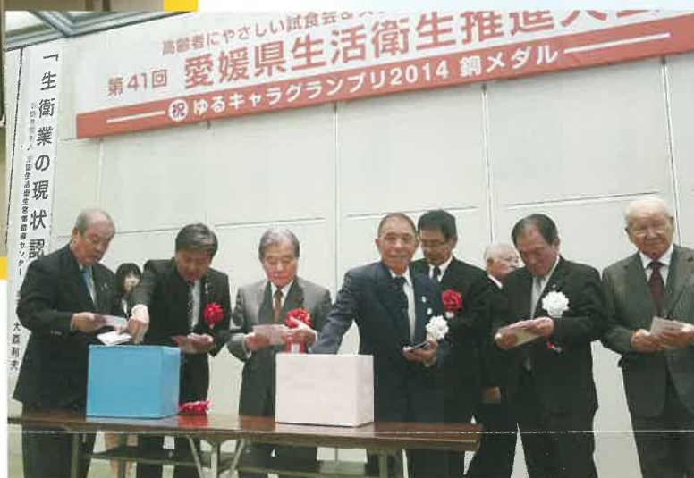
▲県議会議員や生衛業の各理事長による公開抽選会。

また10月1日から末日まで、愛媛県内で実施された高齢者対象の健康づくりと買い物弱者支援「スタンプラリー事業」応募者(2274)に対して、県内生衛連合会加盟店で使える利用券(2000円相当)が当たる公開抽選が行われ100名が選ばれた。