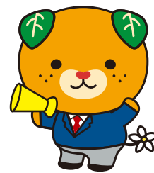
愛媛県 イメージアップ キャラクター みきゃん

※各セミナー後、従業員意識調査アンケートなどの課題に取り組んでいただく可能性がございます。あらかじめご了承ください。 ※携帯メールアドレスはご登録いただけません。 ※ご登録いただいた情報は適正に管理し、本事業のみに利用いたします。